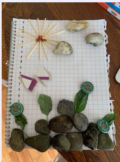
Voorbeeld van een landschap